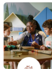
Clubs enfants de 4 à 17 ans