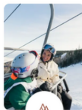
Billets de remontées mécaniques