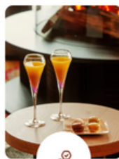
Bar ouvert complet Boissons avec et sans alcool