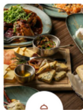
Cuisine gastronomique avec des produits locaux