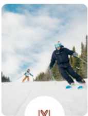
Cours de ski & planche à neige dès 4 ans

Des vacances placées sous le signe de la détente ! École de Yoga, de randonnée, de vélo de montagne ou cardio-training tout est inclus.